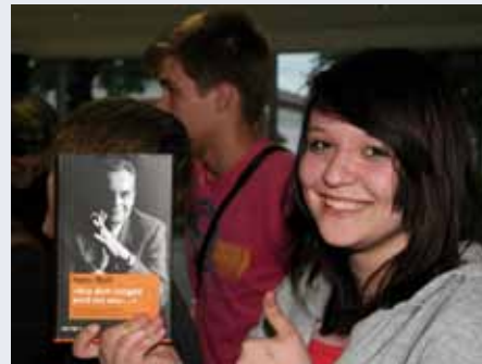
mit seinem Buch „Aus dem Jungen wird nie was ...“