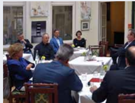
Kaminabend mit Jens-Holger Kirchner (re.), Staatssekretär für Verkehr (2017).