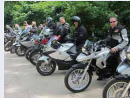
Unsere Motorradtouren mit Unterstützung von BMW waren ausgebucht.