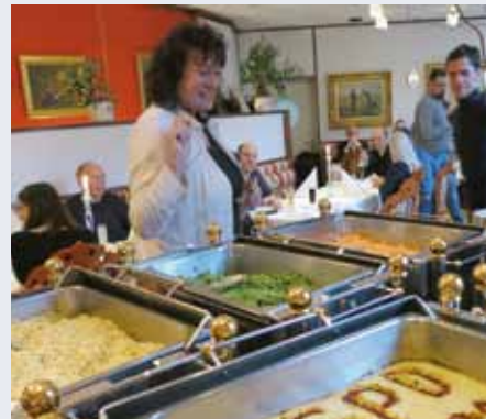
Gemeinsames Abendessen in Veli's Restaurant.