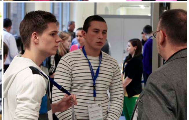
Fotos: Swen Gottschall, Jana Siredentopf; Grafik: © Scanrail – Fotolia.com

Wirtschaft und Schule – ein „Paar“, das häufig nebeneinander her lebt, sich oft sogar auseinander gelebt hat. Man redet gerne übereinander, seltener miteinander und noch seltener kommt dabei etwas Konstruktives für die Unternehmen und die künftigen Azubis heraus, denen von Unternehmerseite so oft fehlende Ausbildungsreife attestiert wird. Wir Unternehmer des Wirtschaftskreises Pankow sind der Meinung: Das muss sich ändern!